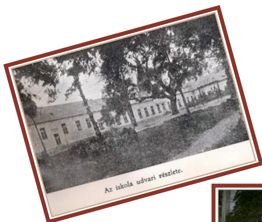
Az iskola udvari részlete.