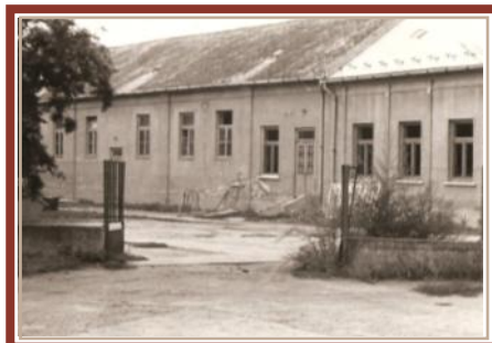
Bővítés előtt 1991 augusztusában