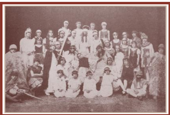
Betlehemes játék (1925)

A második világháború alatt a Vörös Hadsereg kórházának rendezte be az iskola és a község háza épületét.