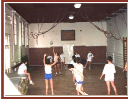
Játék az új tornateremben (1991)