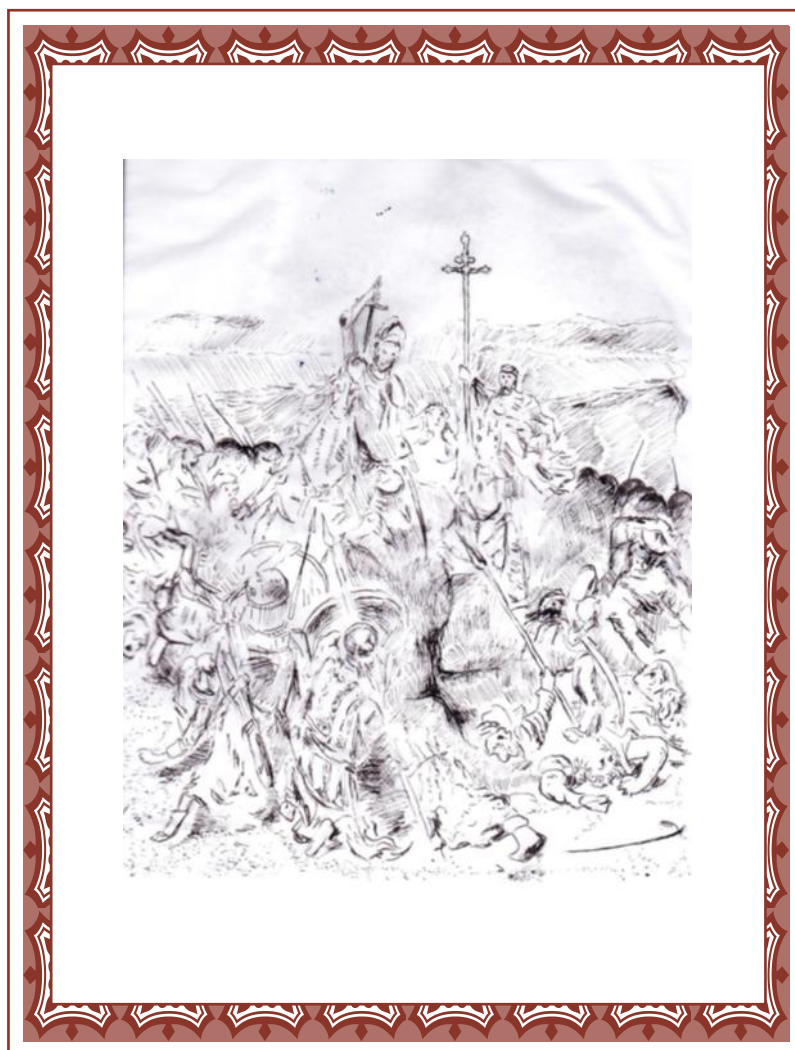
Készítette: Fülöp Nóra (8.b)