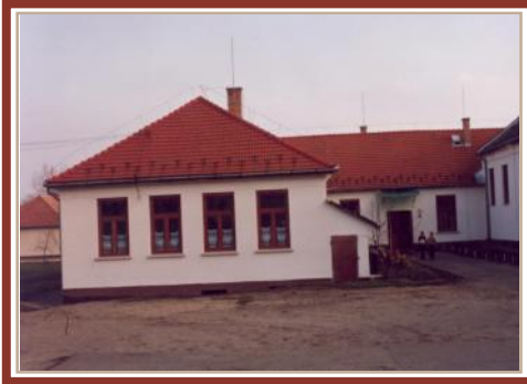
Felújítás után (1991)