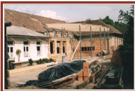
Készül a „kisiskola” aulája (2006)

1976-ban a felső tagozat udvarára egy faház került, mely az úttörő-élet színterévé vált. Még ebben az évben felépült a gyermekkönyvtár, ami a községi könyvtár fiókkönyvtáraként üzemelt. Egy évvel később, 1979-ben a műhelytermek mögött sportpálya létesült.