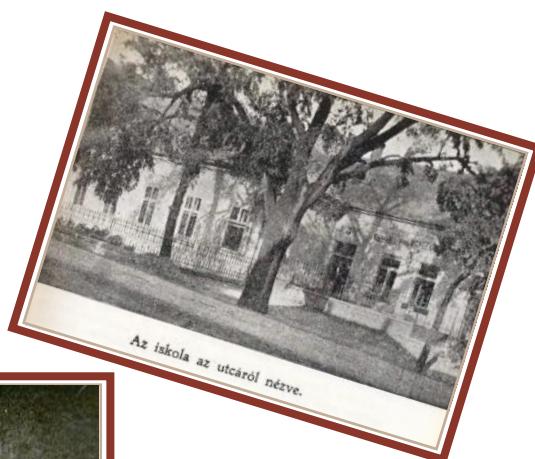
Az iskola az utcáról nézve.