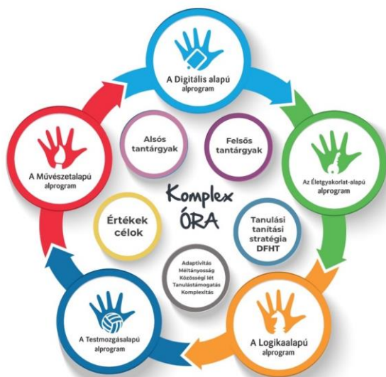
A komplex órák felépítése