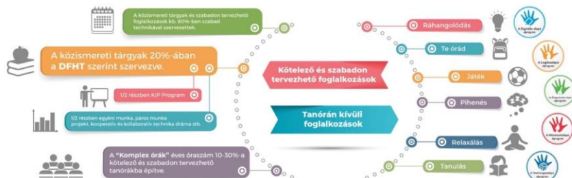
A Komplex Alapprogram tanítási-tanulási stratégiához kapcsolódó elemei